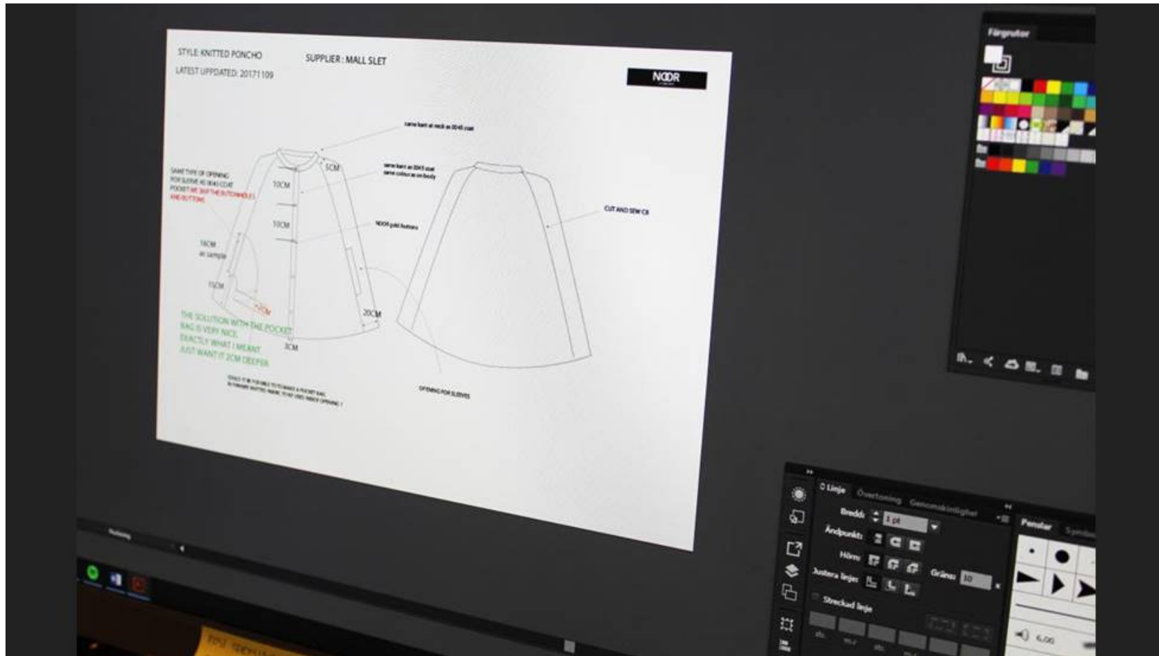
"Recept". Det visar mått och hur plagget ska se ut.