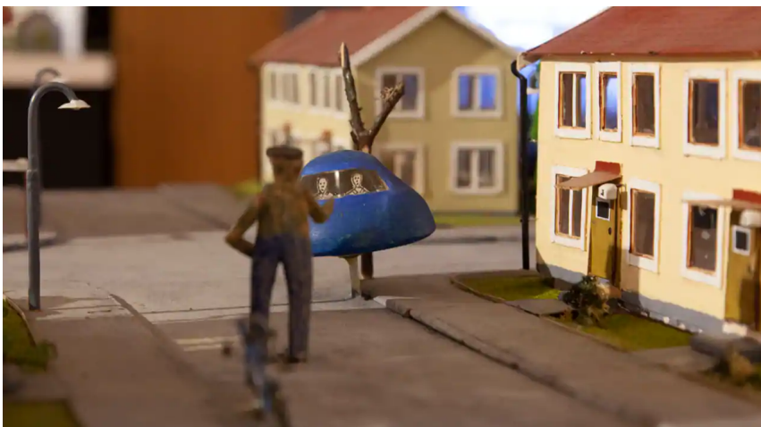
"Finns det intelligent liv? Kanske"

– Utställningen handlar om vad UFO-Sverige arbetar med och om de rapporter vi fått in och tycker är bra. Det är modeller, modeller och bra bilder på det människor påstått att man sett. Vi är väldigt nöjda med utställningen. Det är första gången en utställning hålls utanför UFO-Sveriges regi.