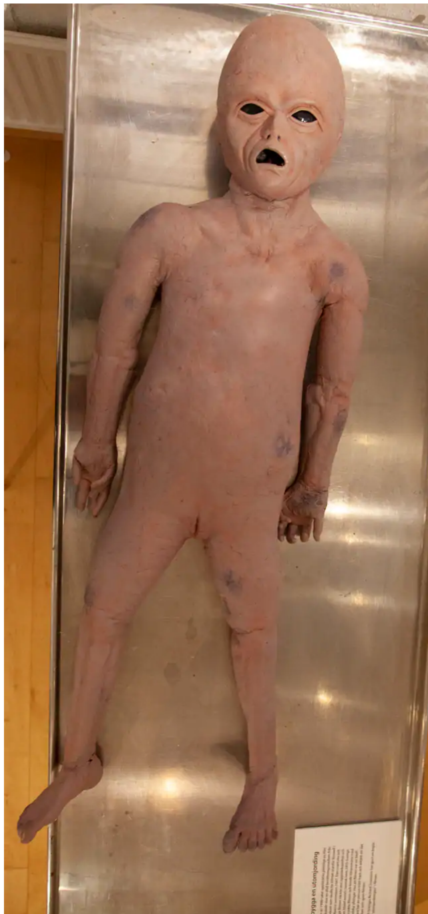
Utställningen i Kristianstad är öppen till 10 mars.